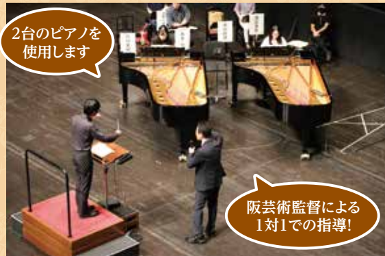
2台のピアノを使用します