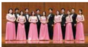
びわ湖ホール声楽アンサンブル

【曲目】日本名歌集「ノスタルジア」より 鈴をおさめて、赤とんぼ、この道 椰子の実、里の秋 こどもとおとなのための合唱曲集 「ゆずり葉の木の下」より あおいあおい、「ゆずり葉」に寄せるバラード 混声合唱とピアノのための「初心のうた」、「そうそうと花は燃えよ」 ほか