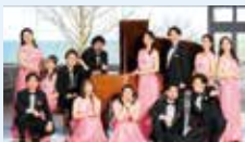
びわ湖ホール声楽アンサンブル

[曲目] 野呂 昶(詩)・千原英喜(作曲): 湖国のあけぼの 森 哲弥(詩)・寺嶋陸也(作曲): 年を忘れた少年の歌 若林千春(編曲): 琵琶湖周航の歌ほか愛唱歌 植松さやか(編曲): 江州音頭 ほか