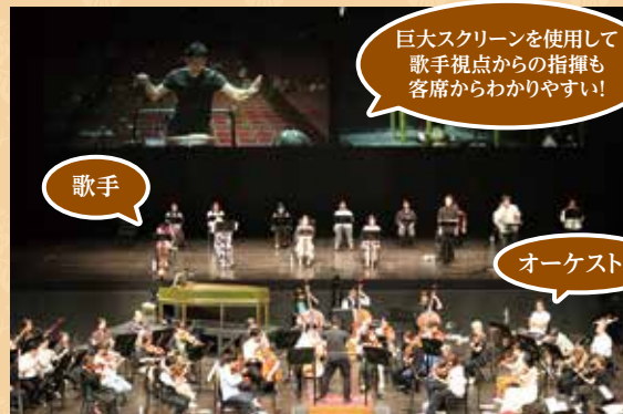
巨大スクリーンを使用して歌手視点からの指揮も客席からわかりやすい!