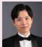
1月・総理大臣 芳賀拓郎