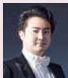
1月・総理大臣 大野光星