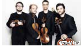
ゴルトムント弦楽四重奏団

使用楽器は全員がストラディヴァリウス。ダイナミックな合奏から繊細な抒情表現まで、「ヨーロッパで最もエキサイティングな弦楽四重奏団」が登場します。