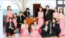
びわ湖ホール声楽アンサンブル

6月20日(土) 14:00開演【小ホール】 一般3,300円(2,750円) 青少年(24歳以下)1,650円