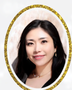
ソプラノ 藤村江奈奈