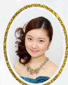
メゾソプラノ 鈴木彩華