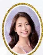
ソプラノ 熊谷綾乃