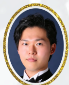
バリトン 芳賀健一