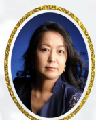
メゾソプラノ 池田香織