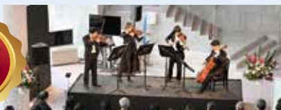
昨年度の公演より