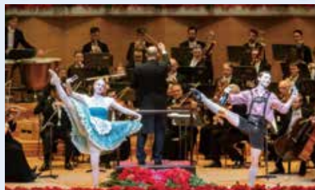
ウィーン・フォルクスオーパー交響楽団