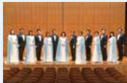
びわ湖ホール声楽アンサンブル

【曲目】モーツァルト：歌劇『ドン・ジョヴァンニ』より 第1幕フィナーレ ドニゼッティ：歌劇『愛の妙薬』より 第1幕フィナーレ ほか