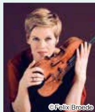
イザベル・ファウスト

2026年1月30日(金) 14:00開演[小ホール] 一般5,500円(4,950円) 青少年(24歳以下)2,200円