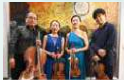
カルテット・エクセルシオ