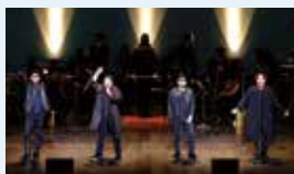
昨年度の公演より

びわ湖ホール声楽アンサンブルが、唱歌や童謡、昭和・平成に親しまれた歌謡曲を熱唱する人気シリーズ第5弾! 8月には文化産業交流会館の特設舞台「長栄座」でもお届けします。 ※米原公演はピアノでの演奏となります。