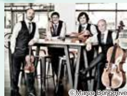
ダネル弦楽四重奏団

6月16日(日) 14:00開演[小ホール] 一般4,950円(4,400円) 青少年(24歳以下)2,200円