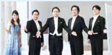
びわ湖ホール四大テノール

びわ湖ホール四大テノールが小ホールで2日間連続公演を開催！「明るい歌声で皆さんを元気に！」をモットーに楽しいステージをお贈りします。