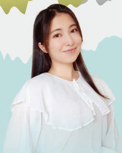
国王の娘…ルーナ姫 アッテンベルジェ北田あやめ