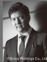
ファルケ博士 大西宇宙