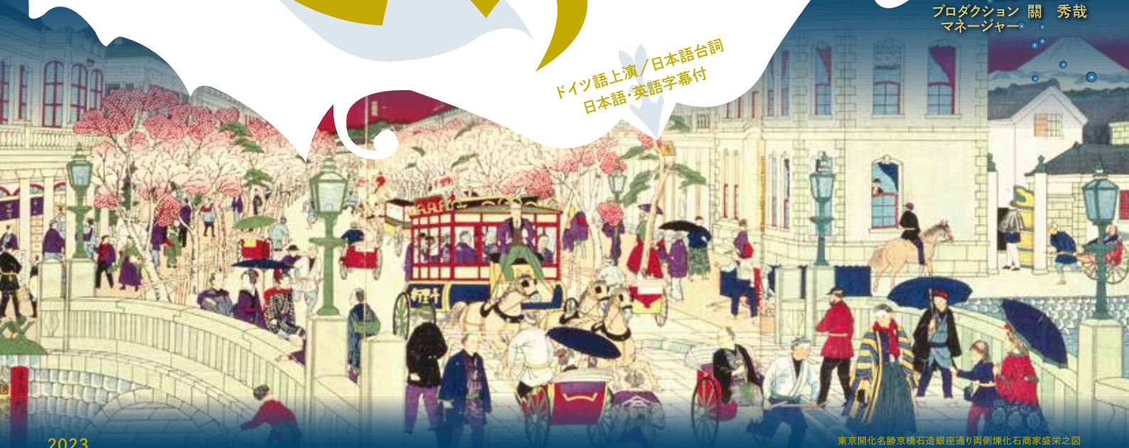
東京開化名勝京橋石造銀座通り両側陳化石商家盛栄之図 東京都江戸東京博物館所蔵

装置 松井るみ 衣裳 半田悦子 照明 杉本光亮 音響 石丸耕一 舞台監督 酒井 健 プロダクション 關 秀哉 マネージャー