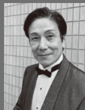
フロッシュ 桂 米團治

＜あらすじ＞ アイゼンシュタインはかつてある仮装舞踏会の帰りに、酔っぱらったファルケ博士を「こうもり」の仮装のまま道ばたに置き去りに。以来「こうもり博士」と呼ばれていたファルケ博士は、いつかアイゼンシュタインに仕返しをしたいと考えていた。ある大晦日、役人を侮辱したことで刑務所に入らねばならず苛立っているアイゼンシュタイン。しばしの別れと悲しむ(フリの)妻ロザリンデ。ファルケ博士は、収監前の気晴らしとアイゼンシュタインをオルロフスキー公爵邸のパーティーに誘う。パーティーには女優に扮したメイドのアデーレ、フランス人になりました刑務所長のフランクの姿も。そこでアイゼンシュタインが口説き始めたハンガリーの貴婦人は…。ドタバタと繰り広げられる大騒動。すべてはシャンパンのせい？