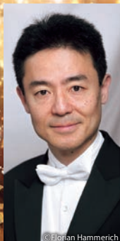
指揮 阪 哲朗 (びわ湖ホール芸術監督)