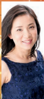
石橋 栄実 (ソプラノ)