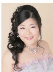
船越亜弥 (ソプラノ)