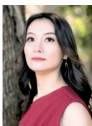
山際きみ佳 (メゾソプラノ)