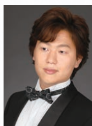
迎 肇聡 (バリトン)