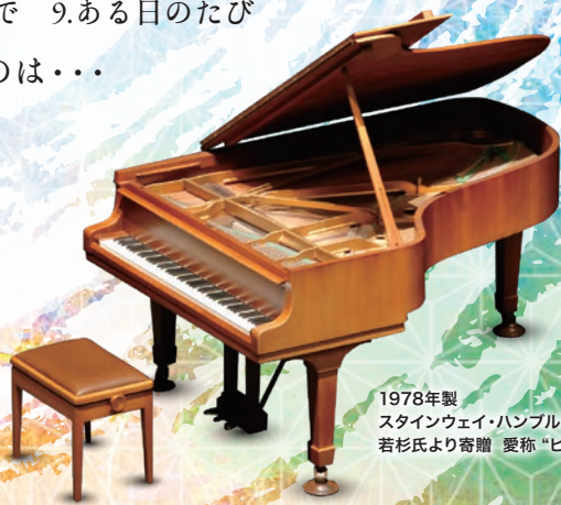
1978年製 スタインウェイ・ハンブルクモデル 若杉氏より寄贈 愛称“ピノ”

助成: 文化庁文化芸術振興費補助金(舞台芸術等総合支援事業) | 独立行政法人日本芸術文化振興会