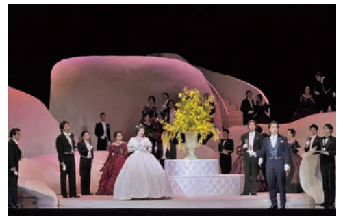
2020年2月東京公演より

再演演出 澤田康子 振付 麻咲梨乃 装置 松井るみ 原演出 原田 諒 衣裳 前田文子 合唱指揮 佐藤 宏 照明 喜多村貴 舞台監督 村田健輔