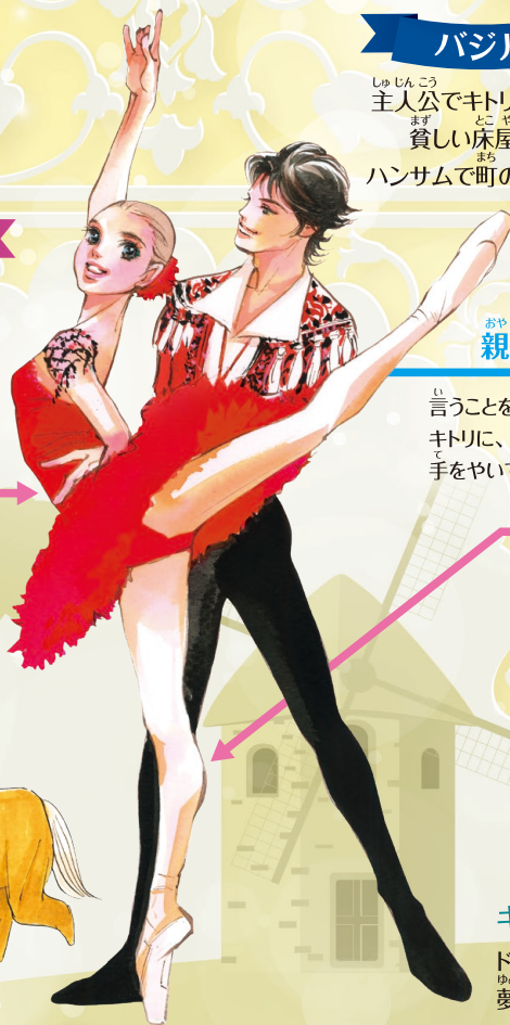
Illustration: Satoru Makimura