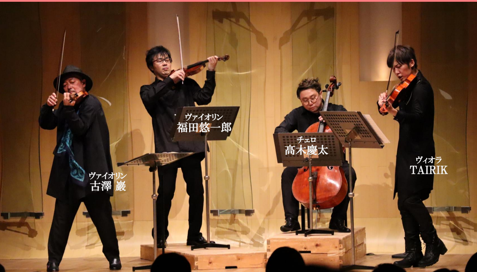
ヴァイオリン 古澤 巖