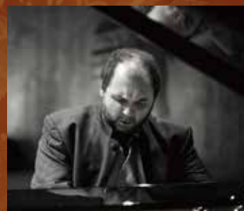
ピアノ ヴァハン・マルディロシアン

助成: 文化庁文化芸術振興費補助金(劇場・音楽堂等機能強化推進事業) | 独立行政法人日本芸術文化振興会