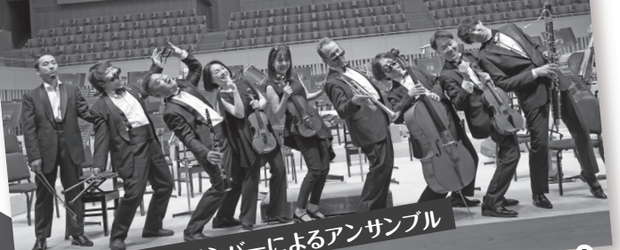
京都市交響楽団メンバーによるアンサンブル