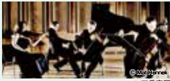
フォーレ四重奏団

ドイツ・グラモフォンからも実力を認められた世界トップレベルのピアノ四重奏団がびわ湖ホールに初登場。フォーレ、シューマンの名曲ほか、大胆アレンジで聴かせる「展覧会の絵」は必聴です。