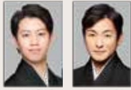
中村耆太郎 片岡愛之助

S席6,000(5,500)円 A席5,000(4,500)円 青少年(25歳未満)4,000円