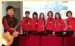
栗東音楽振興会(RISS)「ピアチェレ」