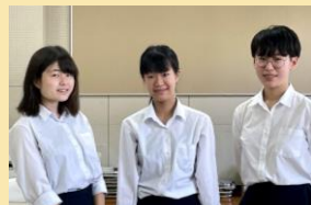
石山高校コーラス部