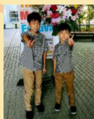
あきたくブラザーズ

音楽を愛する世代を超えた仲間たち。一般公募で選ばれたバラエティ豊かな10組の演奏をお楽しみください！