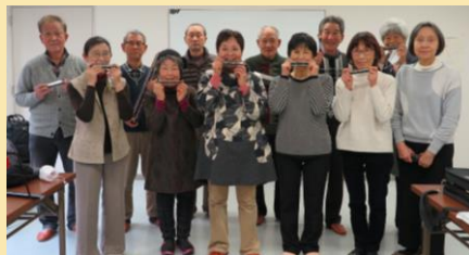
ハーモニカ・ソサエティ with YOU