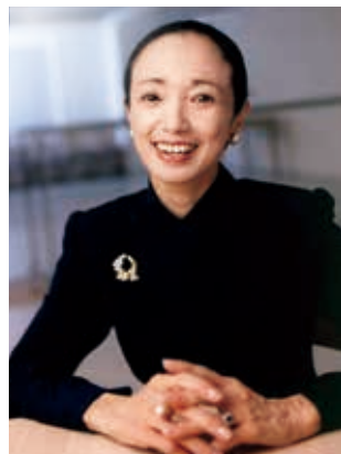
ジュリエット 森下洋子 Morishita Yoko