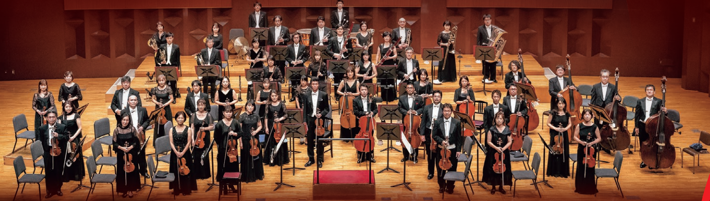
日本センチュリー交響楽団 (管弦楽)

びわ湖ホールチケットセンター TEL. 077-523-7136 https://www.biwako-hall.or.jp/ 10:00~19:00/火曜日休館、休日の場合は翌日。12/29、30、1/1~3は休館。ただし、チケットセンターは12/30は電話受付のみ、12/31は10:00~17:30電話受付・窓口ともに営業。