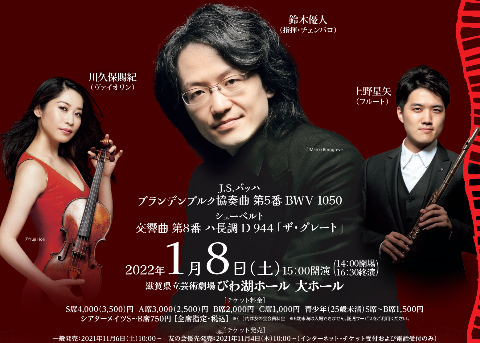
鈴木優人 (指揮・チェンバロ)